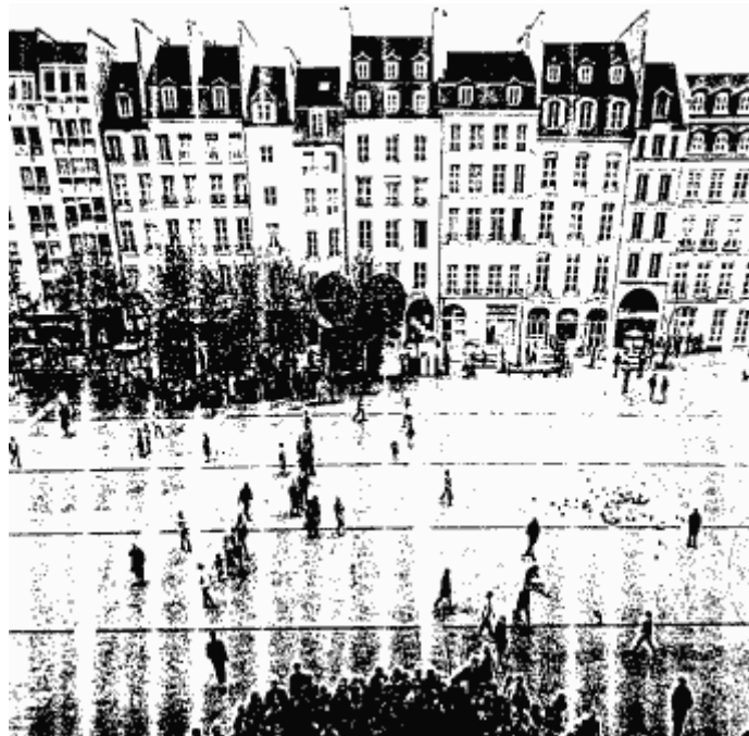
Piano e Rogers, Centro culturale George Pompidou, Parigi, 1971 - 1977