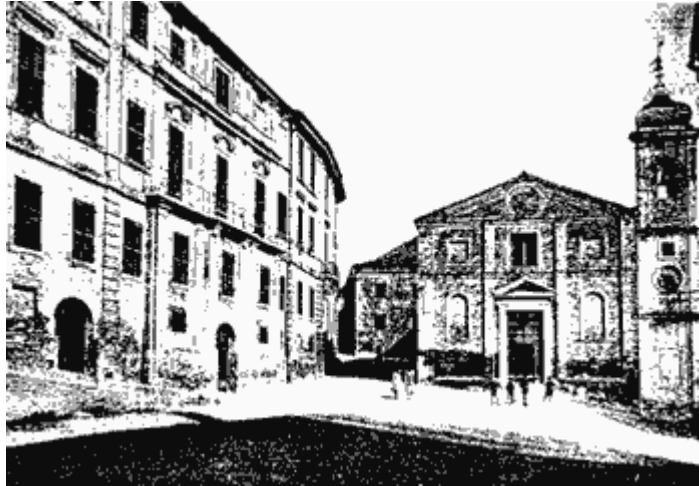
Recanati, piazzola Sabato del Villaggio

I fanciulli gridando sulla piazzuola in frotta, e qua e là saltando, fanno un lieto romore.